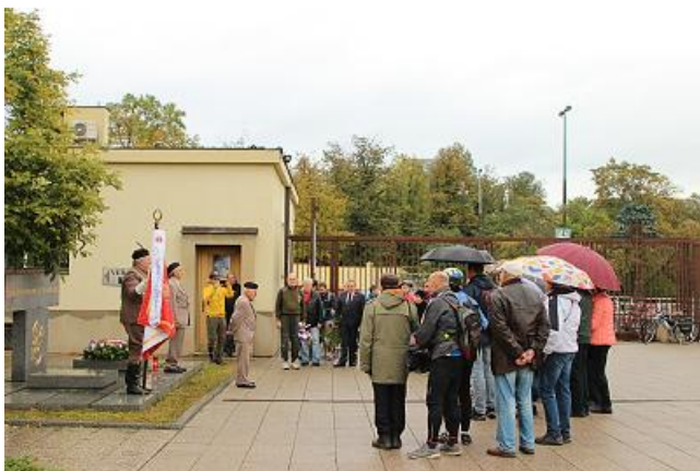
Pietní akt u sokolské hrobky v Krematoriu Strašnice