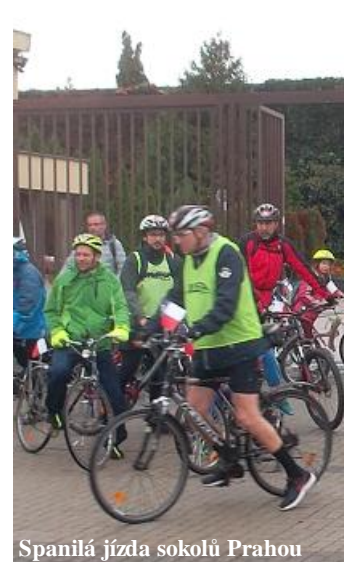
Spanilá jízda sokolů Prahou