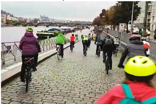
Spanilá jízda Sokolů přijíždí na náplavku u Výtoně