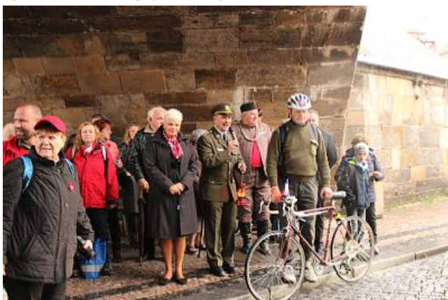
Slavnostní zakončení akce Spanilá jízda Sokolů Prahou a zahájení akce Sokolská světla. Sokolským světlem zapáleným u hrobky Tyrše a Fügnera na Olšanech byly zapálena sokolské světélka na lodičkách na Čertovce (obr. vpravo).