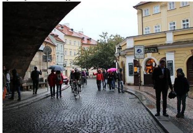
Spanilá jízda Sokolů přijíždí do cíle na Kampu pod Karlův most