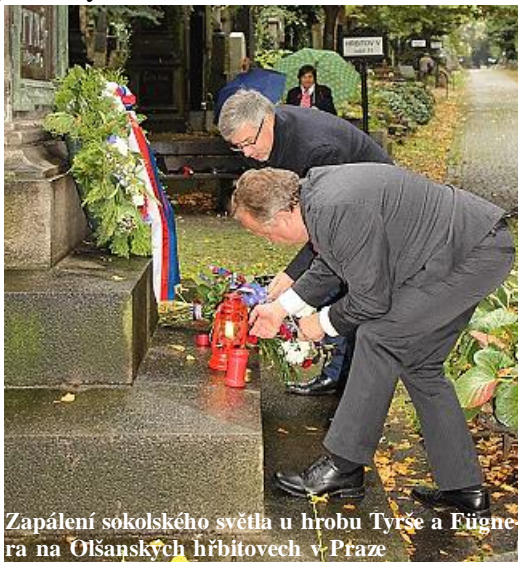
Zapálení sokolského světla u hrobu Tyrše a Fügnera na Olšanských hřbitvech v Praze