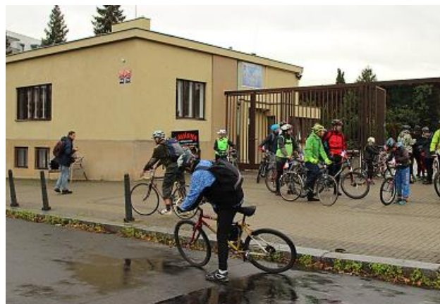
Spanilá jízda Sokolů vyjíždí od strašnického Krematoria